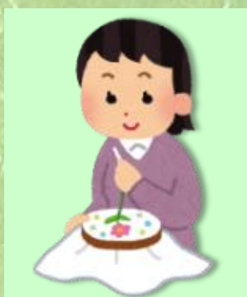
④ フランス刺しゅう 「ティッシュケース」