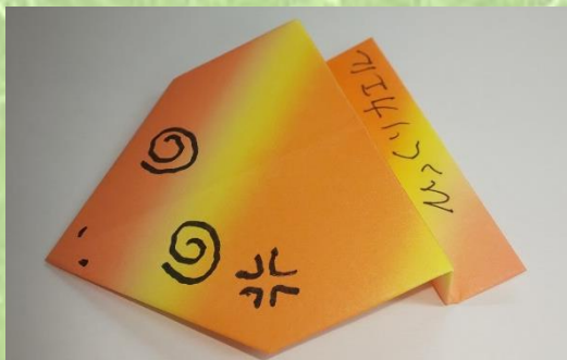
② 遊び折り紙 「ひっくりカエル」ほか