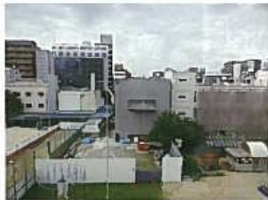
着々と進む北校舎の増床工事

「道徳心・社会性の育成」で目指す子ども像は「互いに違いを認め合い、仲よく助け合う子ども」。縦割り班活動を通して、仲良く助け合う力がつくようにします。ただし、縦割り班活動だけ頑張ればよいというのではなく、係活動、当番、委員会活動などいろいろな場面で、誰とでも協力して決められた役割を果たす力がつくよう取り組んでいきます。この力が将来、社会生活を送るうえで大切な力と考えています。