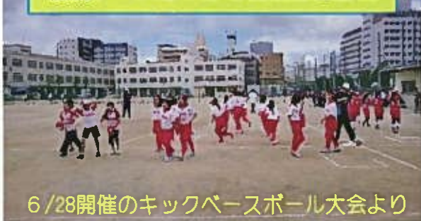
6/28開催のキックベースボール大会より