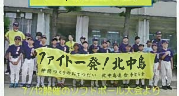
7/12開催のソフトボール大会より