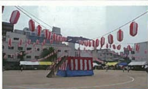
檣の周りで皆で踊りの輪をつくりましょう