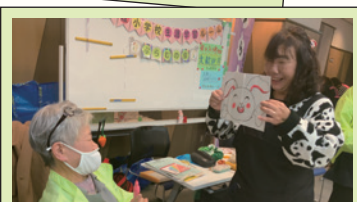
パタパタ絵本づくり