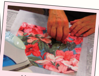
地球にやさしい 「みつろうラップ」づくり