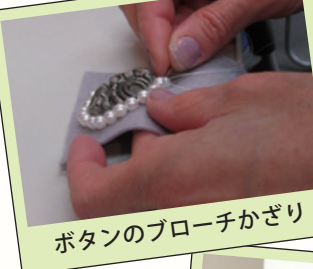
ボタンのブローチかざり