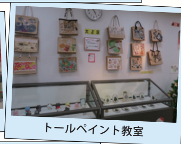
トールペイント教室