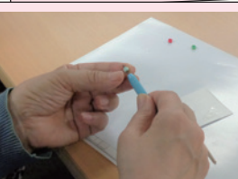
ペーパーキリングで キーホルダーづくり