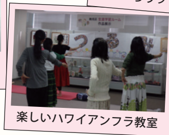
楽しいハワイアンフラ教室