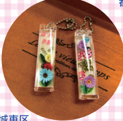
城東区「ペーパーキリングのキーホルダーを作ろう」

総合生涯学習センターでは、生涯学習ルームのみなさんにご協力いただき、作品展や体験教室を実施しています。今号では、2024年4月から8月に実施いただいた5区の様子をご紹介します。