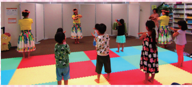
都島区「ALOHA!フラダンスをおどってみよう」