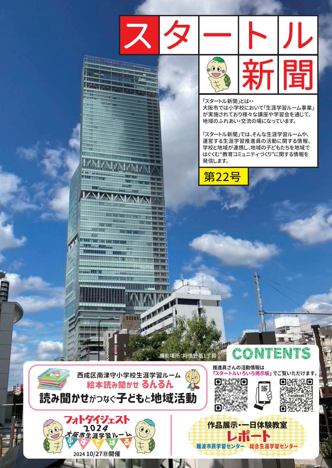
撮影場所:阿倍野筋1丁目