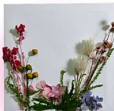
平野区 瓜破東小学校 生涯学習ルーム