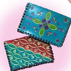
西成区 天下茶屋小学校 生涯学習ルーム