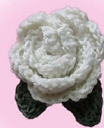
阿倍野区 常盤小学校 生涯学習ルーム