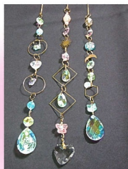
住吉区 大領小学校 生涯学習ルーム