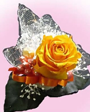
東住吉区 鷹合小学校 生涯学習ルーム