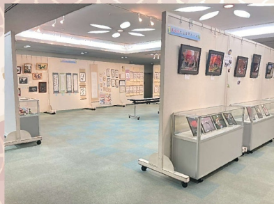
昨年度の作品展示の様子