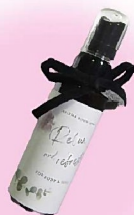
東成区 中本小学校 生涯学習ルーム