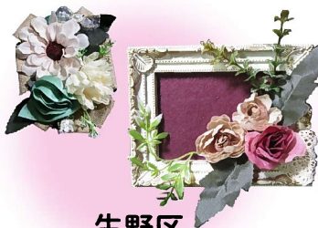
生野区 東桃谷小学校 生涯学習ルーム