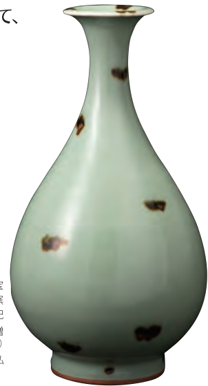
国宝 飛青磁 花生 龍泉窯 元時代・14世紀 住友グループ寄贈 (安宅コレクション)

大阪市立東洋陶磁美術館は、韓国と中国の陶磁器からなる安宅コレクションを住友グループが大阪市へ寄贈したことを契機として建設され、昭和57年(1982)11月に開館した美術館です。一昨年開館40周年を迎えましたが、韓国陶磁などの李秉昌(イ・ビョンチャン)コレクションの寄贈をはじめとした館蔵品の収集などによって、世界的にも優れた美術館の一つとなって参りました。今回のエントランスホールやカフェの増築とリニューアルまでの沿革と館蔵品の概要を中心に大阪市立東洋陶磁美術館の魅力を紹介いたします。