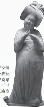
加彩 婦女俑 唐時代・8世紀 住友グループ寄贈 (安宅コレクション)