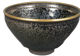
国宝 油滴天目 茶碗 建窯 南宋時代・12-13世紀 住友グループ寄贈 (安宅コレクション)

「やきもの」とも呼ばれる陶磁器は、特に東アジア地域で数多くの優れた作品が生まれました。その主要な生産地である中国・韓国・日本といった地域では、それぞれに特徴のある陶磁器が生み出されました。そうした各国の優れた特色ある作品を一堂に見て、比較できることも、大阪市立東洋陶磁美術館の魅力の一つと言えます。3つの国の陶磁史の変遷の概要と、それぞれの国の名品をご紹介します。大阪市立東洋陶磁美術館の世界を堪能していただきます。