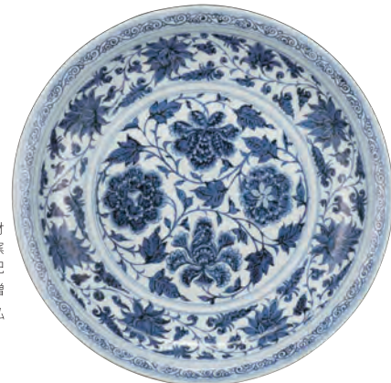
重要文化財 青花 牡丹唐草文 盤 景德鎮窯 元時代・14世紀 東畑謙三氏寄贈