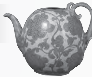
重要文化財 青磁象嵌童子宝相華唐草文水柱 高麗時代・12世紀後半-13世紀前半 住友グループ寄贈 (安宅コレクション)

主な著作・論文には、「煎茶のやきもの―清風の賞玩」『淡交ムック 初心者のためのやきもの鑑賞入門―見かたが分かるやきもの基本―』淡交社(2000)、「磁州窯系陶器の流れ」『別冊太陽 中国やきもの入門』平凡社(2009)、など。