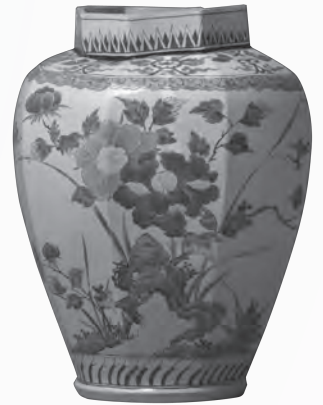
色絵 牡丹椿文八角壺 肥前・有田窯 江戸時代・1680-1710年代