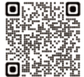
いちようネット QR コード

いちようネット ( https://www.manabi.city.osaka.lg.jp ) にアクセスし、「講座・イベント」をクリックして「検索キーワード」欄に講座名を入力・検索のうえ、お申込みください。